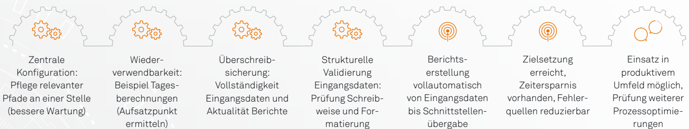
Abbildung 3: Wesentliche Erkenntnisse und Projektergebnisse

Die Dauer zur Erstellung des Berichts durch den Roboter wurde bei gleichbleibend hoher Qualität erheblich reduziert. Die eingesetzte Robotization-Software UIPath stellte sich dabei als effizient und vergleichsweise einfach in der Anwendung heraus, ohne dass zunächst größere Investitionen in Infrastruktur und, in Zusammenarbeit mit msgGillardon als Implementierungspartner, Schulung notwendig wurden.