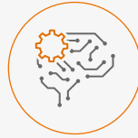
2. RPA (robotic process automation)

Obgleich diese Kürzel häufig ohne Unterscheidung verwendet werden, stehen sie doch für zwei sehr unterschiedliche Einsatzszenarien und deren inhärente Verantwortlichkeit.