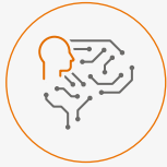
1. RDA (robotic desktop automation)

Um die Bandbreite der Nutzungsmöglichkeiten zu strukturieren, empfiehlt es sich, die Anwendungsfälle in zwei Gruppen einzuteilen: