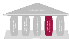
Capital Markets Investment Firms