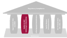
SREP Sanierung & Abwicklung