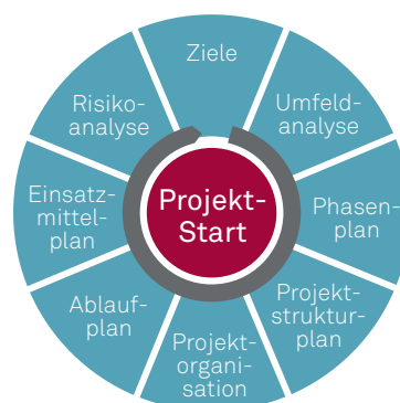
Unterstützungspaket von msg für den Projektstart