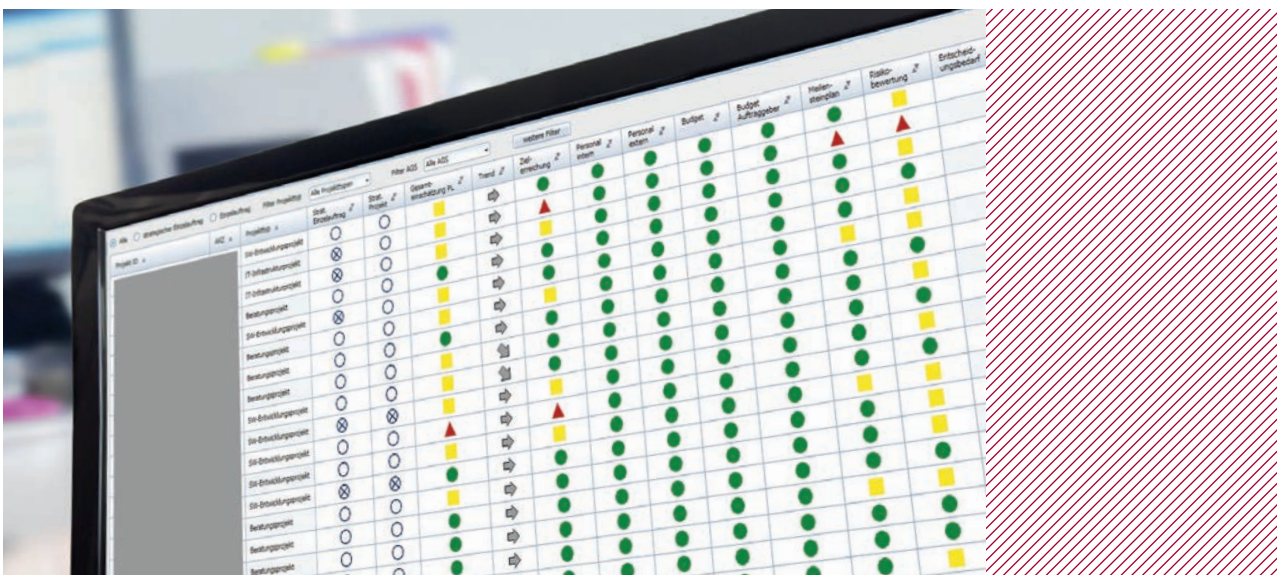
Abbildung 2: Multiprojekt-Dashboard des ITZBund